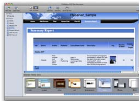
Utilizzate i temi di PHP Site Assistant per creare siti Web dalla grafica favolosa in pochi minuti.

FileMaker Server 10 fornisce potenti funzioni di sicurezza per proteggere i vostri dati. Utilizzando il protocollo SSL, crittografate i dati trasferiti tra i database ospitati e i client desktop. Proteggete le informazioni sensibili filtrando la visualizzazione dei nomi dei database ospitati in base ai privilegi dell'utente. Gestite gli account utente e le password efficacemente attraverso l'autenticazione esterna, utilizzando gli standard industriali Active Directory e Open Directory.