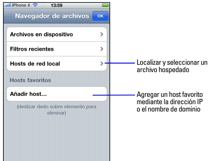
Conexión de una base de datos hospedada en FileMaker Go for iPhone

Los dispositivos se conectan a las bases de datos hospedadas como lo hacen con cualquier otro cliente, mediante el privilegio ampliado fmapp.