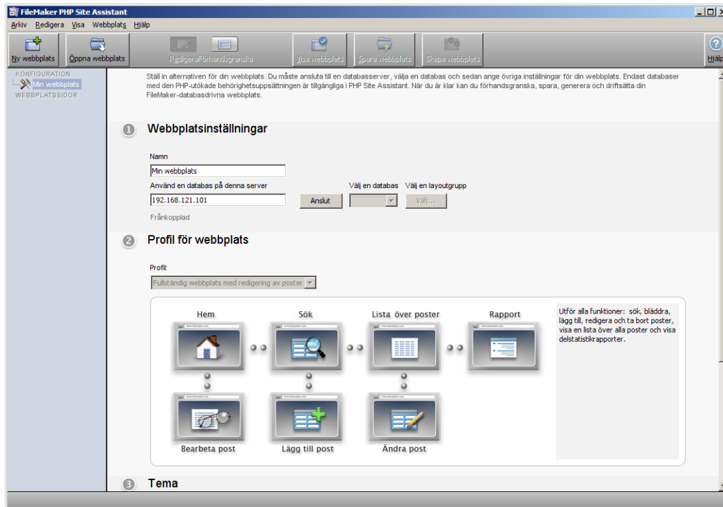
Fönstret PHP Site Assistant